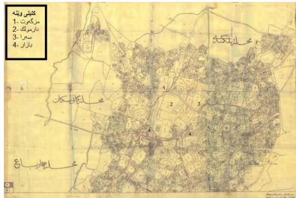
سەرچاوه: به‌رئوبه‌راه‌تى تومارى خانوبه‌ره‌ى سلیانی په‌ك.

(ئەستێرناسى) به‌شیتوه‌ى كۆشكى عوسمانى، كه له‌وى ئەمه په‌كیه‌كه له پایه‌دارنى به‌روى كۆشك بوو، له كۆشكى میرى بابانیشدا هه‌روها بوو، له ئەركه‌كانى مونه‌جیم-باشى، بۆمبوونه، ئه‌وه‌بوو كه رۆژ و ته‌نانه‌ت ساتى ده‌ست پێكردنى كارێك یان به‌رئوبه‌ر كه‌وتن دیارى بكات. له ساتیه‌كى به‌خته‌وه‌رى وادا. (ى.ئى. فاسیلیه‌فا، 2009، 157)