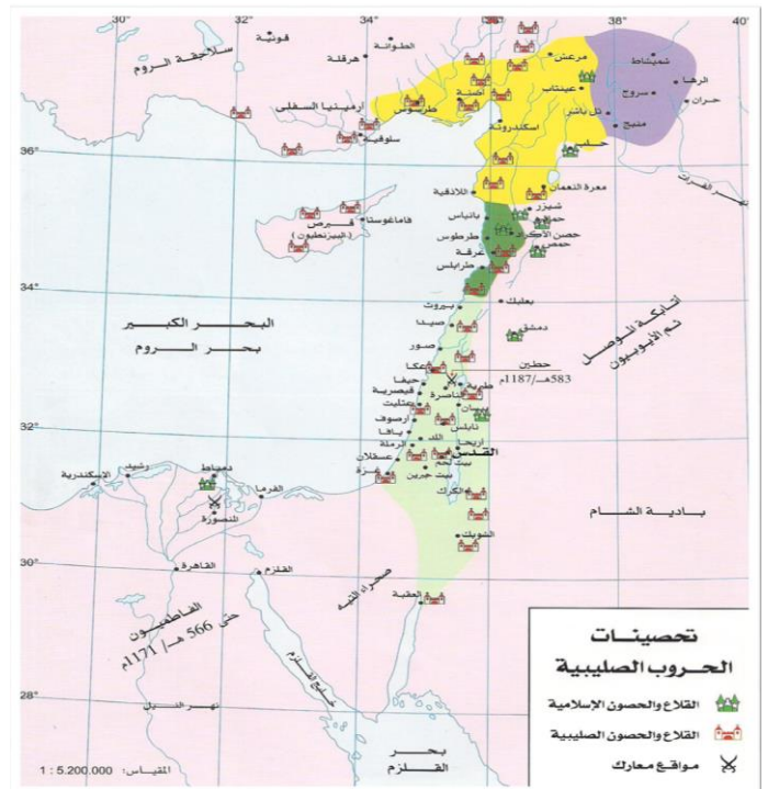
فءلا و فامكاربهكانى خاجيهكان، الكاتب وآخرون، 2014، 2.138